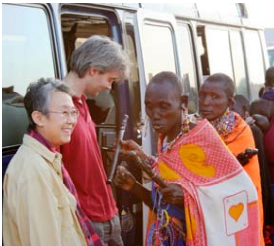
Maasai vendiendo artesanías a turistas - Kenya

El turismo a favor de los pobres es un turismo que genera beneficios netos para los pobres. Los beneficios pueden ser económicos y ambientales así como sociales y culturales. No se debe