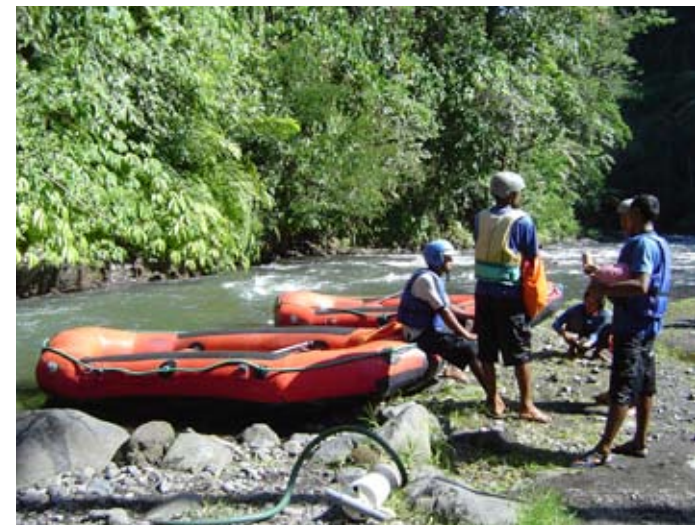
Rafting entre campos de arroz

sus gastos básicos de vivienda o alimentación). Las donaciones son, en ciertos casos, bienes y servicios donados para apoyar la conservación de los humedales.