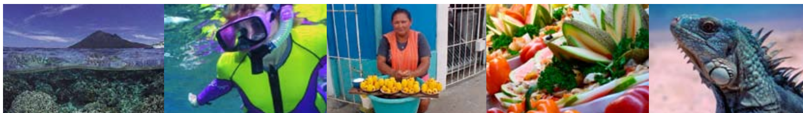
De izquierda a derecha: Bote de submarinistas en Bunaken y Submarinista, TUI Nederland / Vendiendo jugo de aguajales en Iquitos, Perú, W. Guzmán / Buffet en República Dominicana, TUI Nederland / Iguana de Bonaire, TUI Nederland